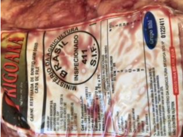
Foto 03 - Carne Resfriada de Bovino sem Osso Frigoara Capa de Filé