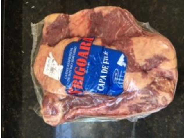
Foto 01 - Carne Resfriada de Bovino sem Osso Frigoara Capa de Filé