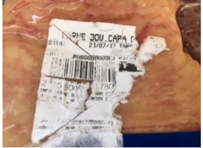
Foto 02 - Carne Resfriada de Bovino sem Osso Frigoara Capa de Filé